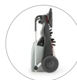
Компактные размеры: простота хранения