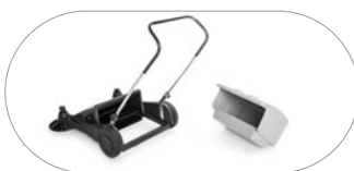
Контейнер для мусора большой емкости